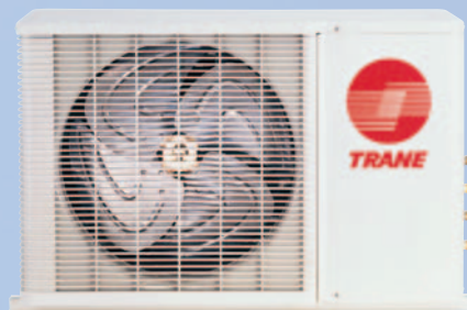
Mezcla de unidades interiores con un sistema de 2 a 1.

Agregue un juego de expansión para acoplar unidades de pared (MCW) al TTT548*00 u otras condensadoras múltiples (terminación 00).