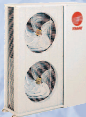
Mezcla de unidades interiores con un sistema de 3 a 1.